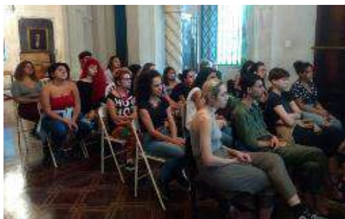
Visita à reserva técnica da Casa Zuzu Angel

Os alunos são incentivados a participar de visitas técnicas tanto como parte das disciplinas em que estão matriculados a fim de terem uma vivência prática do que estão aprendendo em sala de aula, como em laboratórios e plantas da instituição a fim de compartilhar o know-how do SENAI CETIQT;