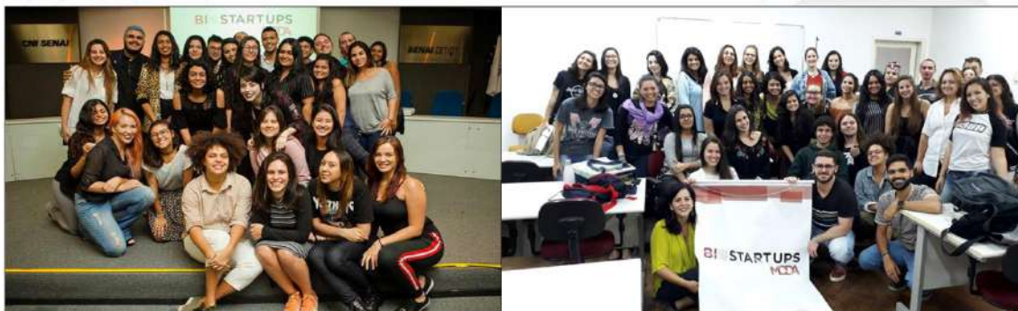
Alunos do SENAI CETIQT e empresários: apresentação final dos nove projetos focados no segmento têxtil e de confecção, elaborados a partir do Projeto Biostartups Moda, realizado em parceria com o Sebrae/RJ.

Tal projeto oportunizou aos alunos conexões com investidores e parceiros, como: “investidor anjo”, aceleradoras, centros de pesquisa, incubadoras, entre outros. Além disso, todos os alunos selecionados participaram de um curso de Biostartups ministrado pelo Sebrae/RJ, com carga horária estimada de 24 horas, contendo informações a respeito: Business Model Generation; Lean Startup; Design Thinking e Customer Development.