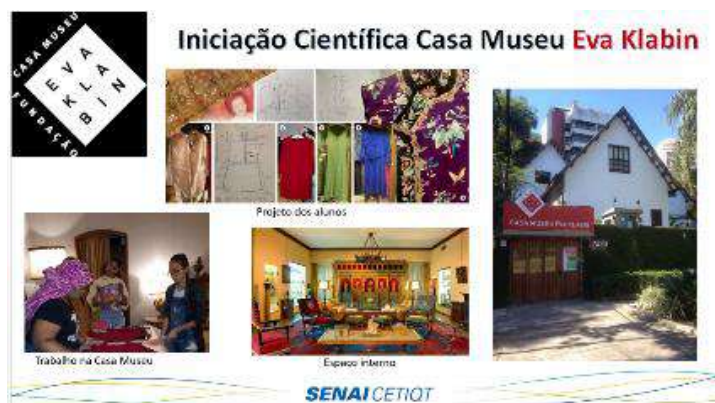
Alunos do SENAI CETIQT apresentam projeto na Casa Museu Eva Klabin Muito trabalho e dedicação para a realização do projeto de Iniciação Científica "O papel da mulher na evolução do Dia-a-dia do Brasil".

Abaixo exemplificamos o resultado de uma pesquisa e exposição realizada em parceria com a Casa Museu Eva Klabin: