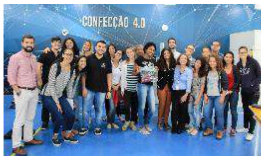
Visita à Planta de Confeção 4.0 do SENAI CETIQT